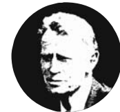
Ian Donald Inter-University School of Medical Ultrasound