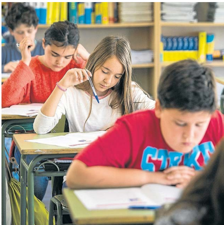
Alumnes de l'Escola Carlit de Barcelona fent les proves de sisè de primària. El sindicat AMES ha denunciat continguts de llibres de text que "adoctrienen" els nens.