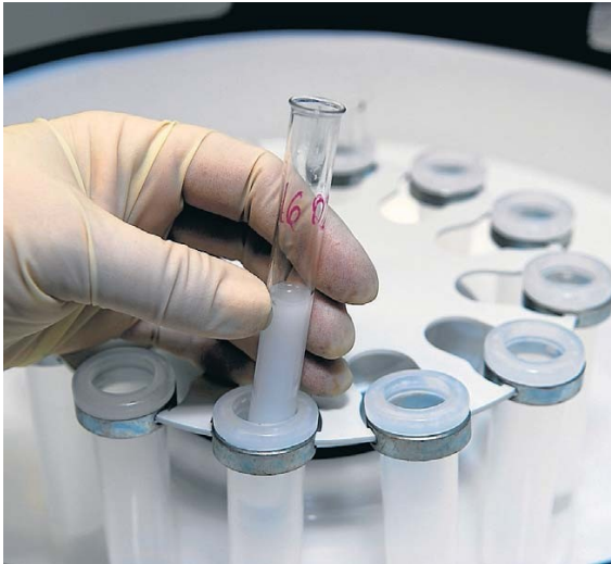
Tubs amb mostres preparades per al seu emmagatzematge.

El fet de poder compartir informació entre clíniques –Espanya és el país d'Europa amb més centres de reproducció assistida– també estalviarà temps i proves duplicades. "Els bancs podran veure les avaluacions dels donants fetes en altres centres i els certificats d'identitat", va expli-