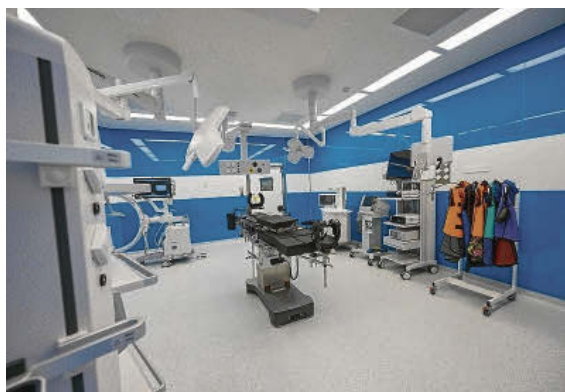
Los quirófanos tienen casi todos los dispositivos en suspensión.