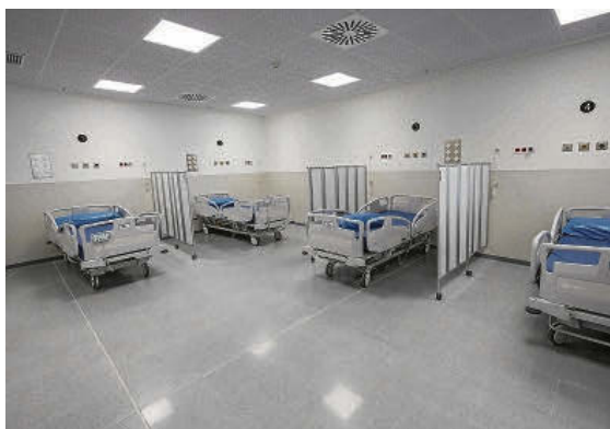
Boxes de Urgencias. Hay circuito separado para adultos y niños.