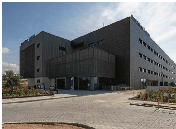
La puerta de acceso es por la avenida Josep Recasens.