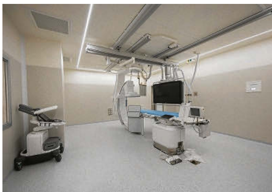
La sala de hemodinámica es de última generación.