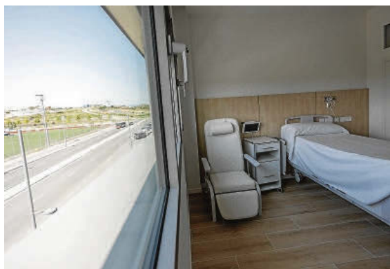
Algunas habitaciones tienen vistas a la Ciutat Esportiva del Nàstic.