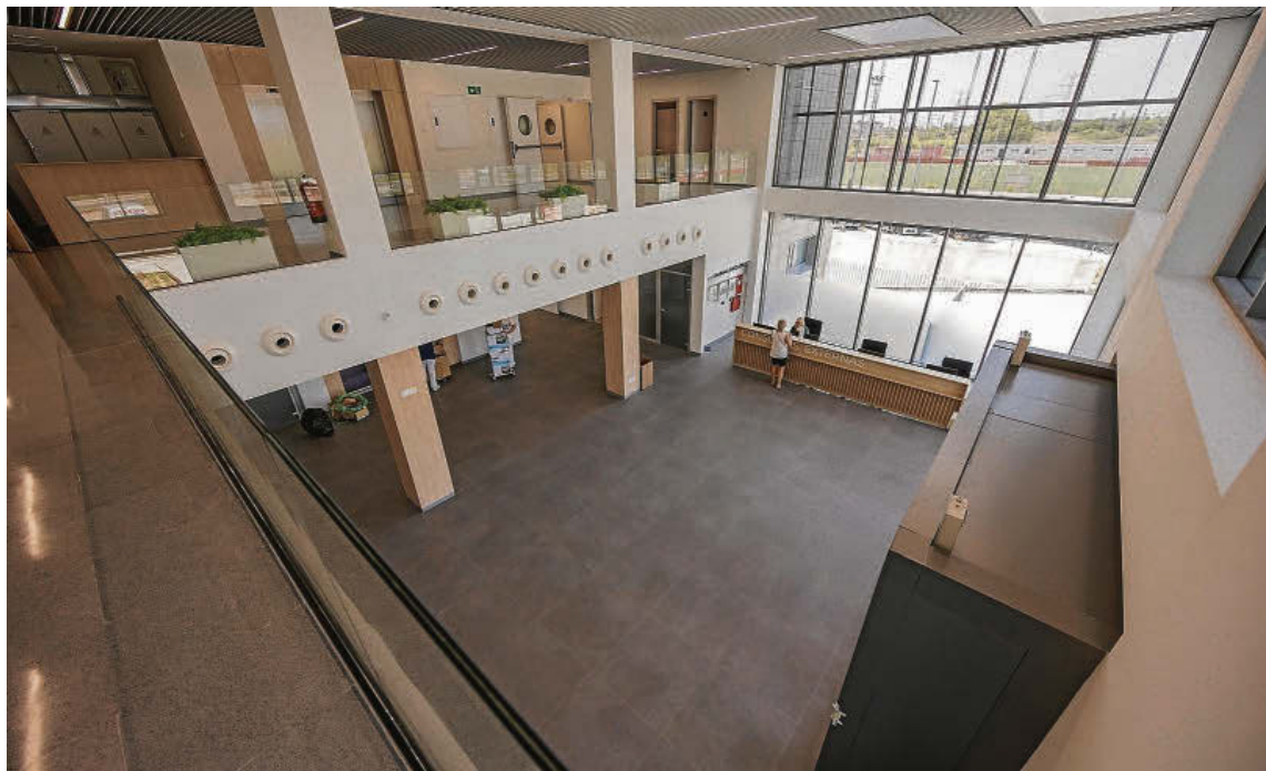
En la planta baja están el vestíbulo, la cafetería para pacientes, las consultas y la unidad de Dexeus Dona.