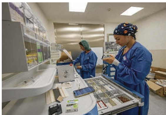
Profesionales sanitarios preparan la torre de medicamentos.