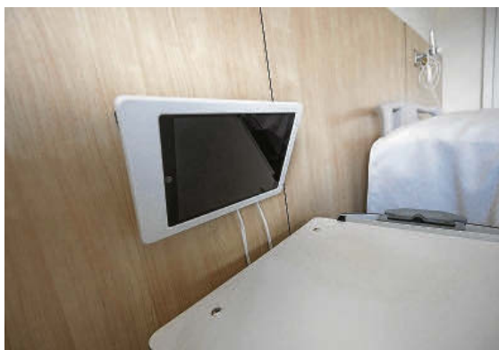
Los pacientes podrán comunicarse con el médico por tablet.